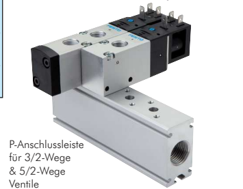
P-Anschlussleiste für 3/2-Wege & 5/2-Wege Ventile