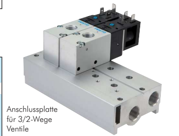
Anschlussplatte für 3/2-Wege Ventile